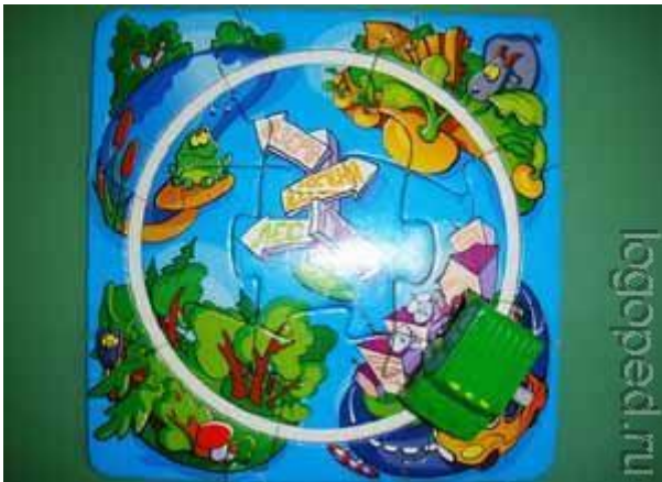
Фото 10. Дорога готова, машина едет, мотор ревет: “ДРРРРРРРРРР”

Все эти игровые задания проверены в процессе многолетней работы с детьми разного возраста и различного характера речевых нарушений. Они обобщают всё ценное, что накоплено к настоящему моменту в области развития речи. Игротека как бы разговаривает с ребёнком “детским языком”.