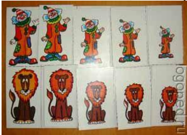
Фото 7. Один веселый клоун, ....., пять веселых клоунов.

Раскладывая картинки по мере убывания, можно проговаривать словосочетания, согласовывая существительные с числительными, автоматизируя звуки “Л”, “ЛЬ”.