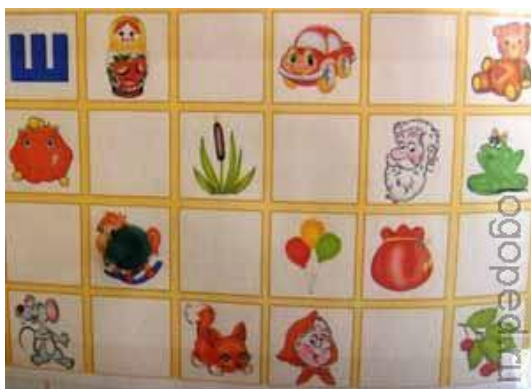
Фото 1. Таблица для автоматизации звука “Ш” в словах.

Задания: “Найди и назови картинку, если двигаться от буквы на третью клетку справа”, “Найди и назови картинку, если двигаться от буквы на одну клетку вниз и на пять клеток вправо”, “Найди и назови картинку, если двигаться от буквы на одну клетку вниз и на пять клеток вправо и на одну вверх”. Эти задания постепенно усложняются. А кроме необходимой мотивации найти слово, ребенок учится ориентироваться на листе бумаги.